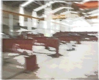
Fabricación de Estructuras Metálicas

En GOLBERT cuenta con equipos para realizar trabajos de montaje de estructuras de acero, montaje de torres de transmisión y montaje de torres de alta tensión.