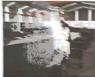
Montaje de Estructuras Metálicas