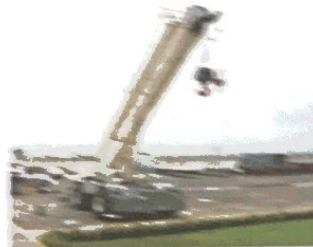
Mantención y Desmontaje de Grúas Torre